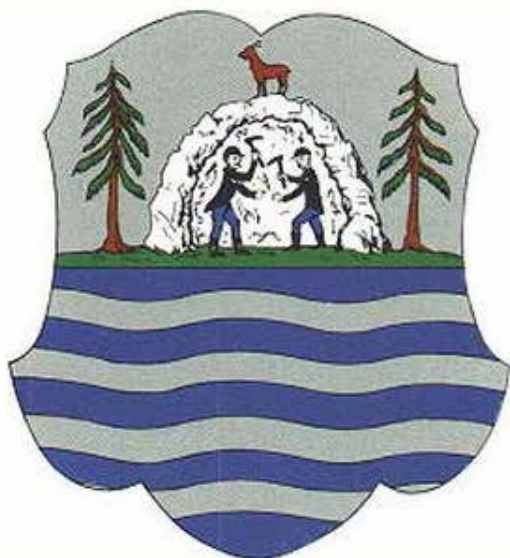
Рис. 5. Герб комітату Мараморош Fig. 5. The coat of arms of Maramorosh Comitatus