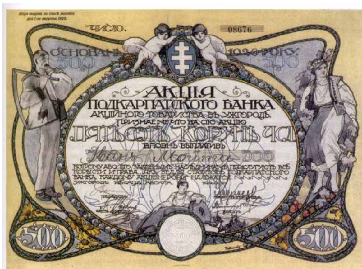
Рис. 13. Акція Підкарпатського банку 1920 р., у виконанні Й.Бокшая [1, р.91] Fig. 13. Action of the Subcarpathian Bank in 1920, performed by Y. Bokshay [1, p.91]