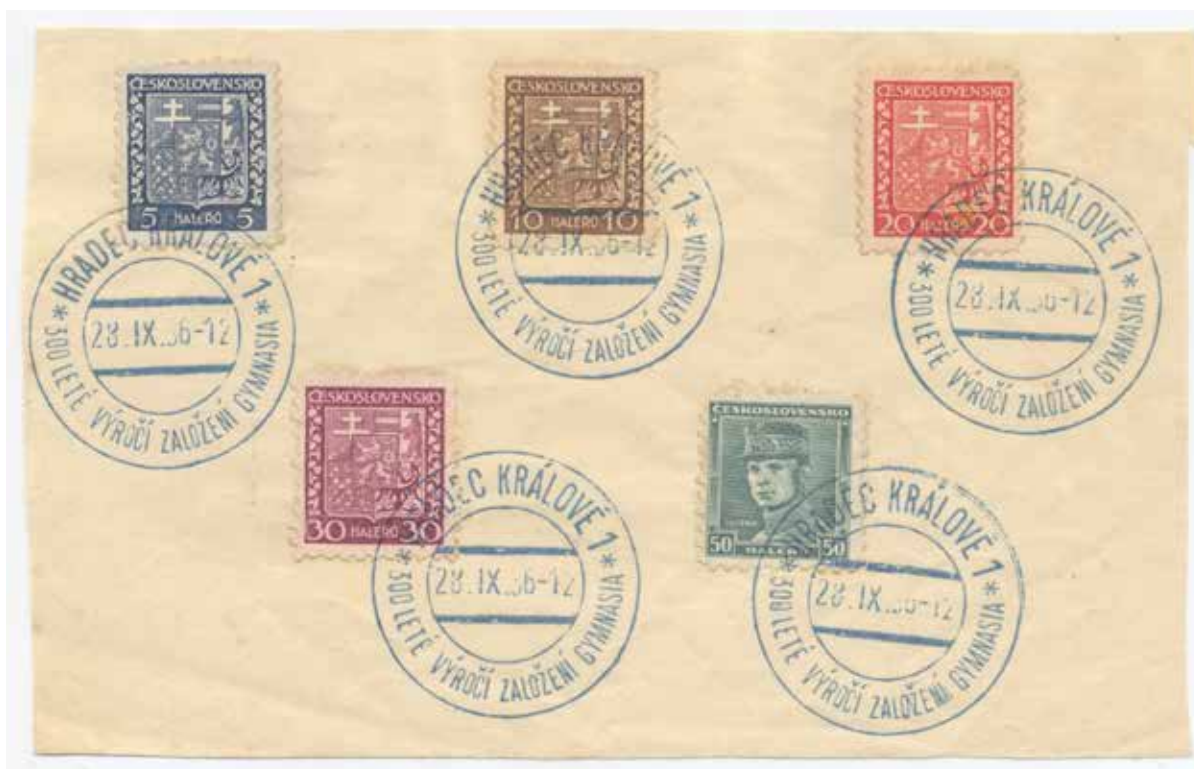
Рис. 11. Погашені марки Чехословацької Республіки. 1936 рік (з колекції автора) Fig. 11. Cancelled stamps of the Czechoslovak Republic. 1936 (from the author's collection)