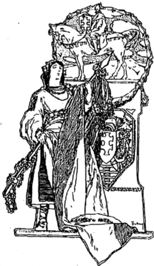
Рис.8. Проект герба Підкарпатської Русі Й.Бокшай [7, с.1] Fig.8. Design of the coat of arms of the Subcarpathian Rus by Y. Bokshay [7,p.1]