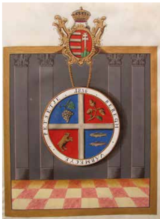
Рис. 2. Герб і печатка комітату Берег [8, арк. 4] Fig. 2. The coat of arms and the seal of the Bereg Comitatus [8, p. 4]