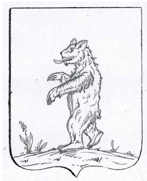
Рис. 9. «Герб с.Кострино» [16] Fig. 9. «the Coat of Arms of Kostrino village» [13]