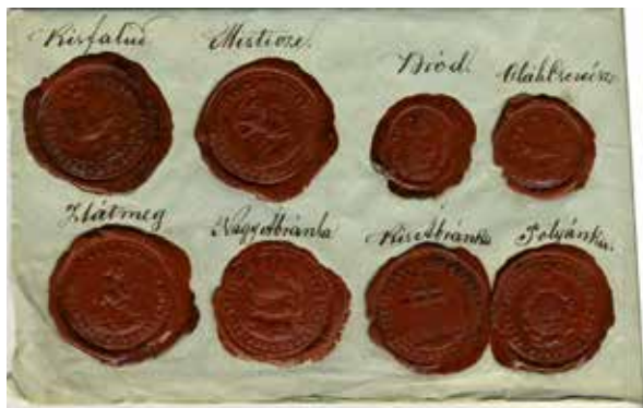
Рис. 1. Відбитки печаток із колекції Т.Легоцького. Fig. 1. Seals' imprints from the collection of T. Legotsky.