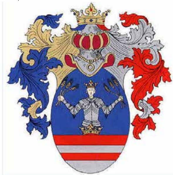
Рис. 3. Герб комітату Унг Fig. 3. The coat of arms of Ung Comitatus