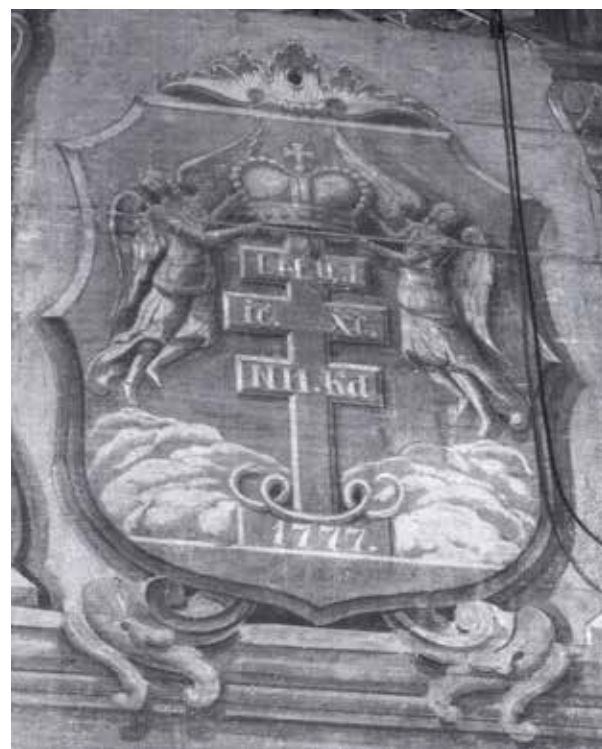
Рис. 12. Герб Мукачівської греко-католицької єпархії на зворотній частині іконостасу Хрестовоздвиженського кафедрального собору м. Ужгорода. Fig. 12. Coat of arms of the Mukachevo Greek Catholic diocese on the back of the iconostasis of the Exaltation of the Holy Cross Cathedral of Uzhhorod.