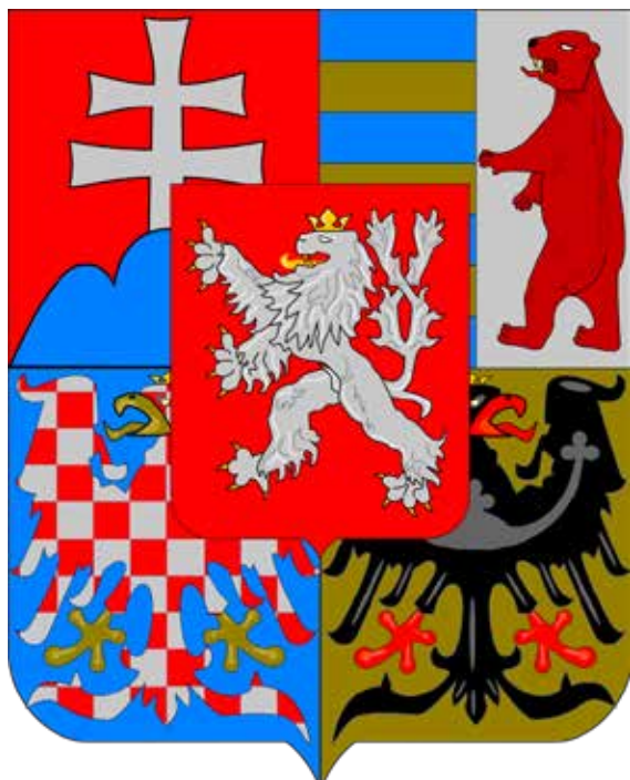
Рис.10. Середній герб Чехословаччини [6] Fig.10. Middle coat of arms of Czechoslovakia [3]