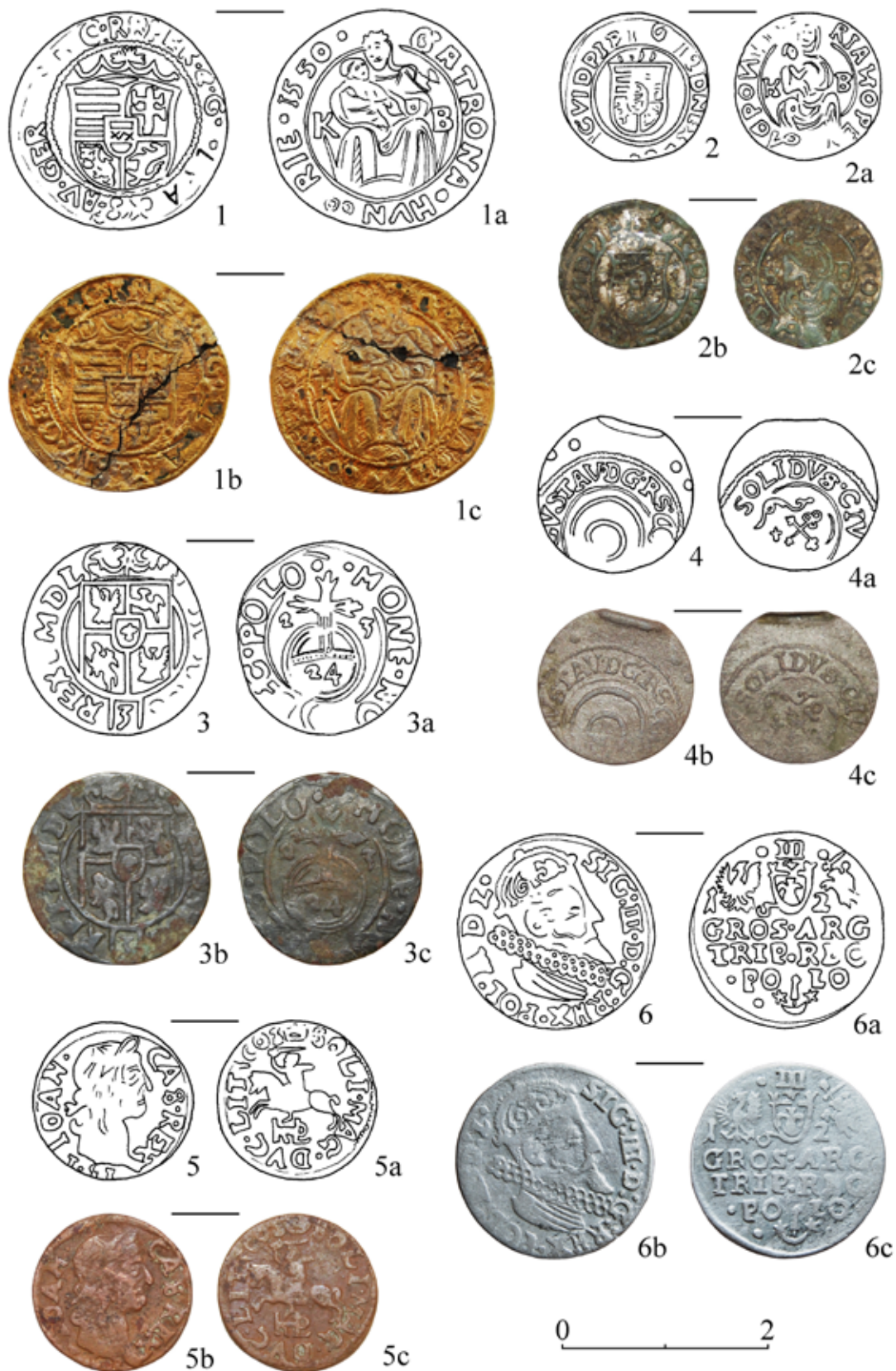
Рис. 2. Середнянський замок. Монети.