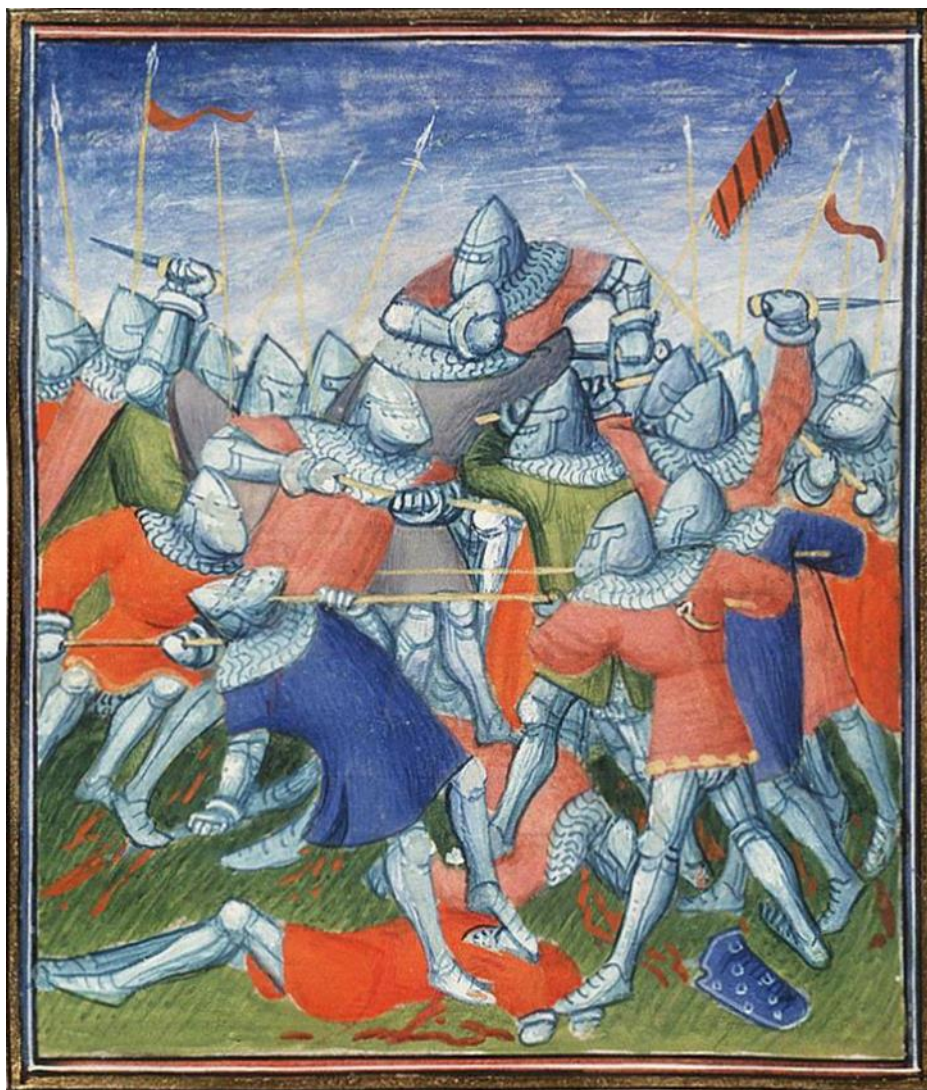
Fig. 7. MS KB, 72 A 25, Jean Froissart, Chroniques (Vol. I), Paris, France, Virgil Master, c. 1410, folio 257r. National Library of the Netherlands, Hague.

Схожу ситуацію, далеку від куртуазних конвенцій, зображає мініатюра Майстра Вергілія із Першої книги Фруассара, що ілюструє битву під Оре (1364) де двоє комбатантів у верхній частині композиції застосовують у тісній рукопашній вочевидь «нерицарські», борцівські прийоми.