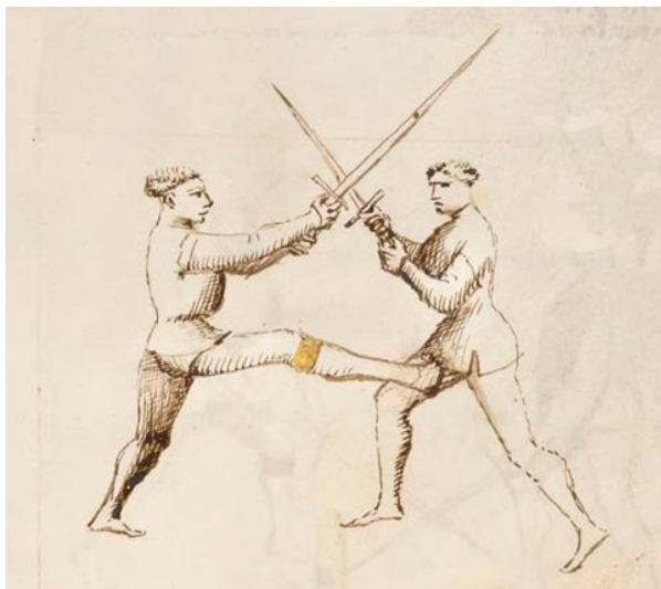
Fig. 1. MS Morgan.383 Fior di Battaglia, 1410-1420, North Italy, folio 26r, Morgan Library & Museum, New York (NY).

«Такий фортель я зроблю своєю ногою та по вашим яйцям. І роблю я це аби завдати вам болю і змусити вас втратити захисну стійку. Оскільки цей прийом мусить виконуватися блискавично, облиште всякі сумніви щодо нього. Захищатися від цього удару потрібно швидко, і то таким чином: боєць має захопити лівою рукою праву ногу противника і тоді він зможе кинути його на землю» [2, fol. 26r].