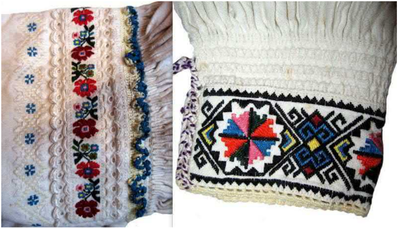
Рис. 5. Оздоблення вишивкою, морщенням і воланами верхньої плечової частини рукава та манжет жіночих «волоських» сорочок великобичківських гуцулок.