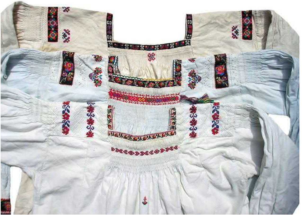
Рис. 3. Оздоблення вишивкою прямокутного вирізу горловини жіночих «волоських» сорочок тересвянських долинянок.