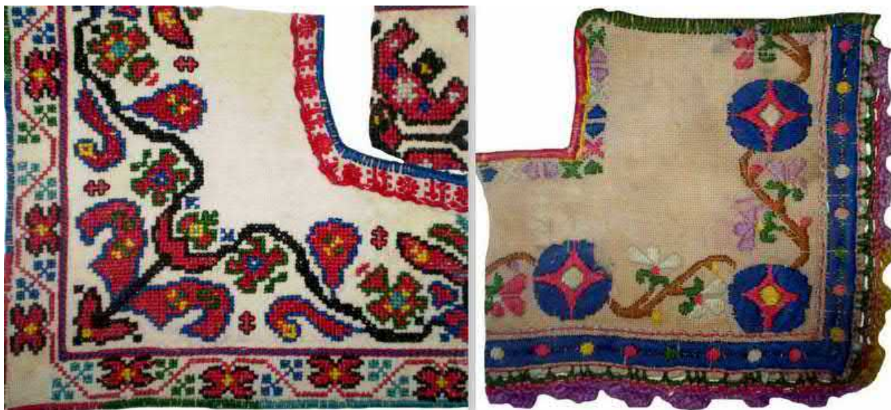
Рис. 7. Оздоблення вишивкою жіночих «волоських» сорочок королевських долинян.