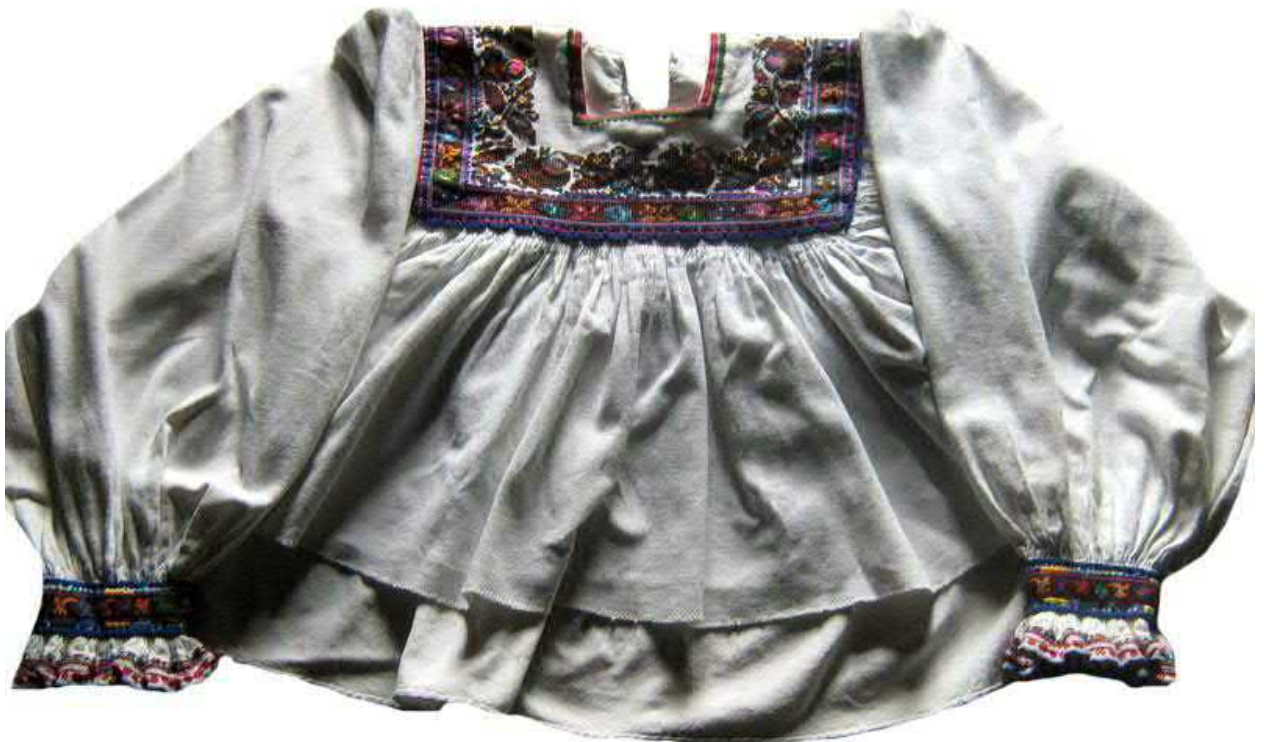
Рис. 6. Жіноча сорочка, с. Хижа Виноградівського району. Домоткане полотно, вишивка. 20-40-ві рр. XX ст.