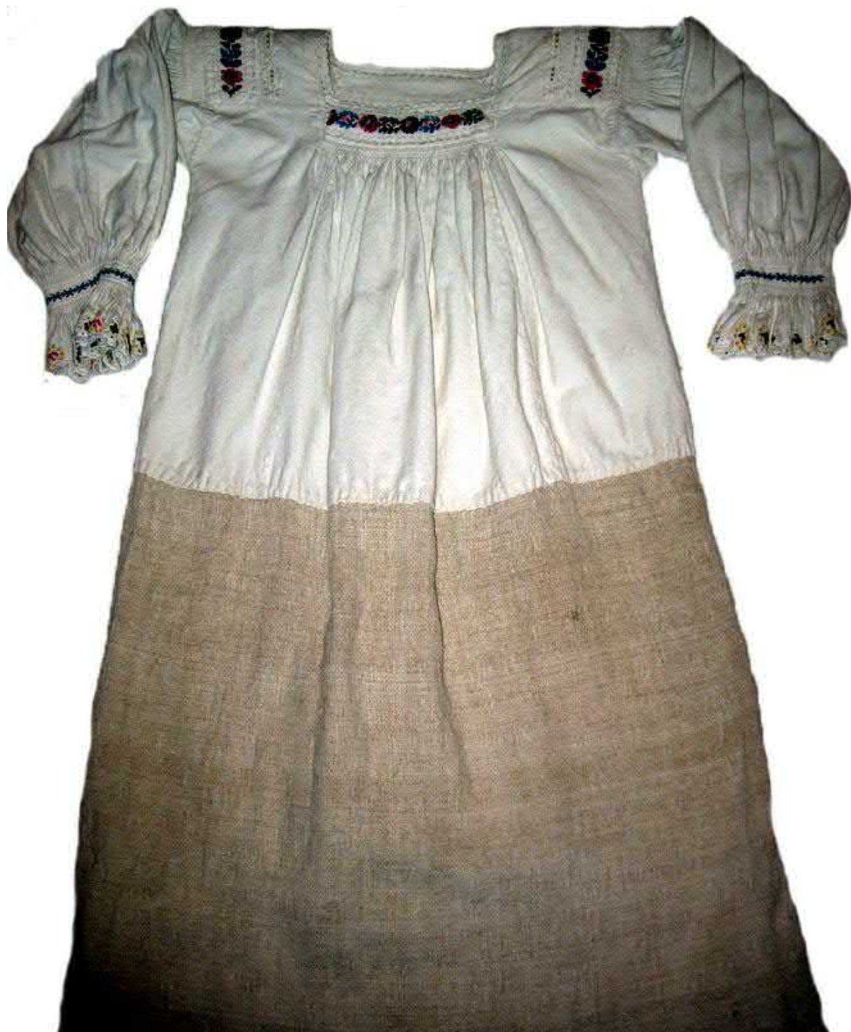
Рис. 4. Жіноча сорочка, с. Верхнє Водяне Рахівського району. Домоткане полотно, вишивка. 20-40-ві рр. XX ст.