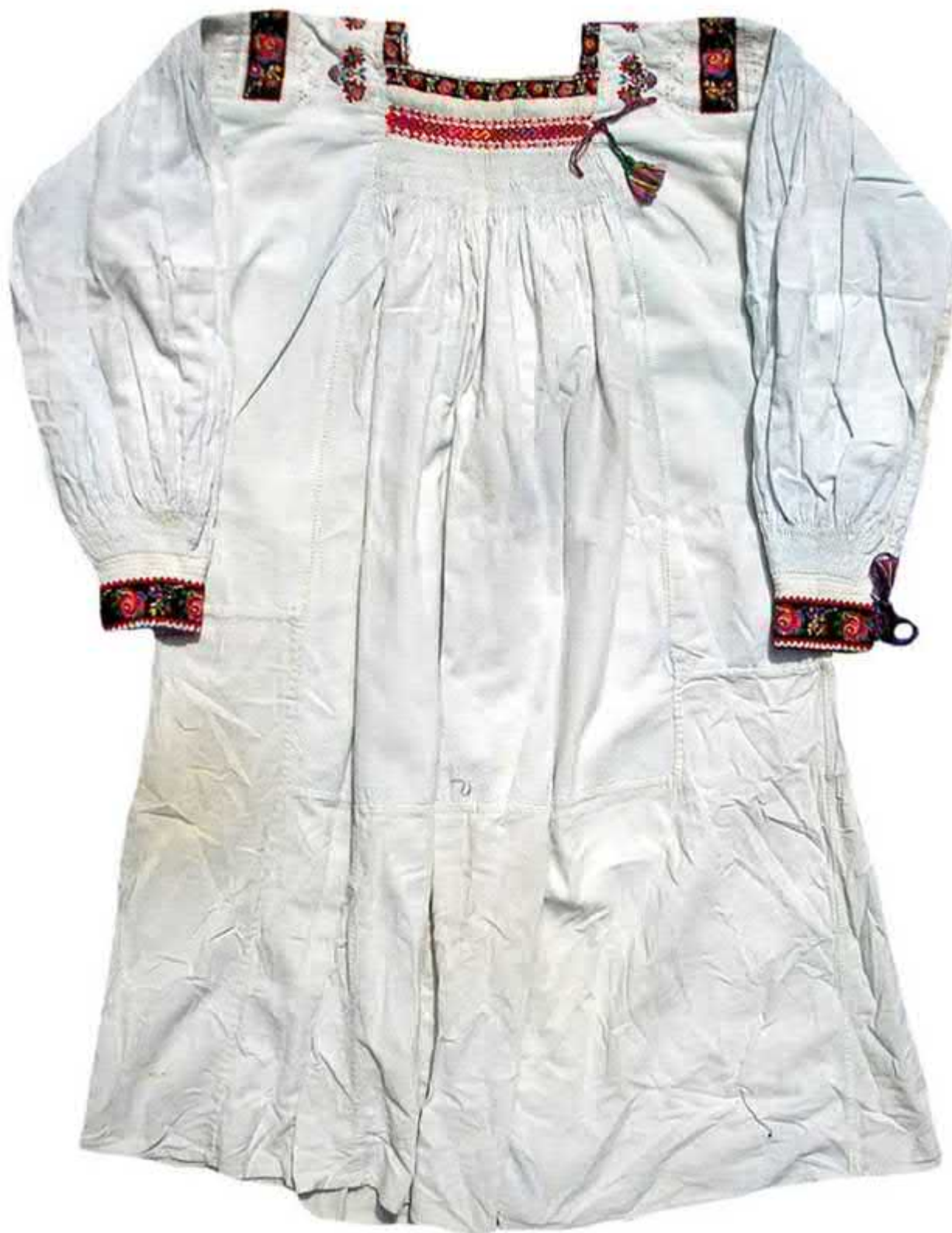
Рис. 2. Жіноча сорочка, с. Дубове Тячівського району. Домоткане полотно, вишивка. 20-40-ві рр. XX ст.