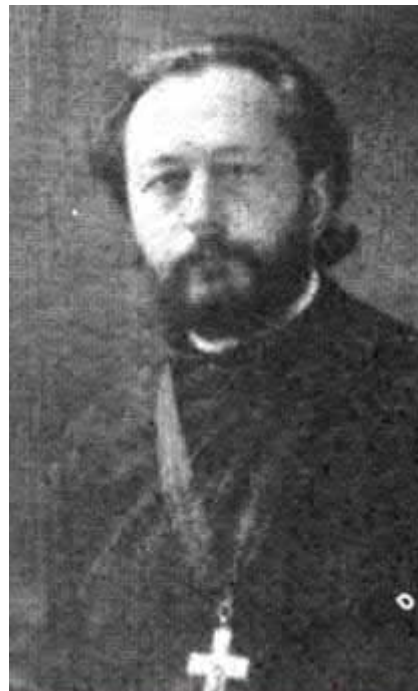
Рис. 1. Протоієрей Іван Чернавін, [Козлов, 2018, с. 185.]

Виклад основного матеріалу. Не викликає заперечень, що головним ініціатором відкриття курсів був прот. І. Чернавін (Рис. 1). Аналіз історіографії свідчить про цілий ряд неточностей у біографії священника. У виданні «Русские писатели эмиграции...», що вийшло в 1973 р. в Бостоні, згадано тільки про діяльність священника у Франції та в США і наведено назви кількох його книг [Русские писатели эмиграции, 1973, с. 144]. Французький історик А. Нів'єр повідомляє, що І. Чернавін народився 4 квітня 1879 р. на території «Вольнської губернії» [Нив'єр, 2007, с. 537]. Наведена інформація про місце народження не відповідає дійсності. Точні відомості про народження та діяльність майбутнього священника можна відтворити на основі третього тому видання «Биографический словарь...», яке вийшло у 2019 р.