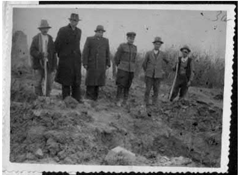
Рис. 1. Слідчі обласної Надзвичайної комісії під час процесу ексгумації поблизу с. Сокирниця [USHMMA, RG-22.002M, f. 7021-628, fol. 0008].

Верифікація нового для історіографії Голокосту Закарпаття джерела виявила неточні відомості стосовно масового розстрілу 300 євреїв із сіл