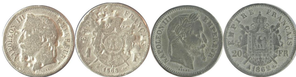
Рис. 2. Тогочасні підробки французьких монет 1860-х рр. зі знахідок Словаччини.