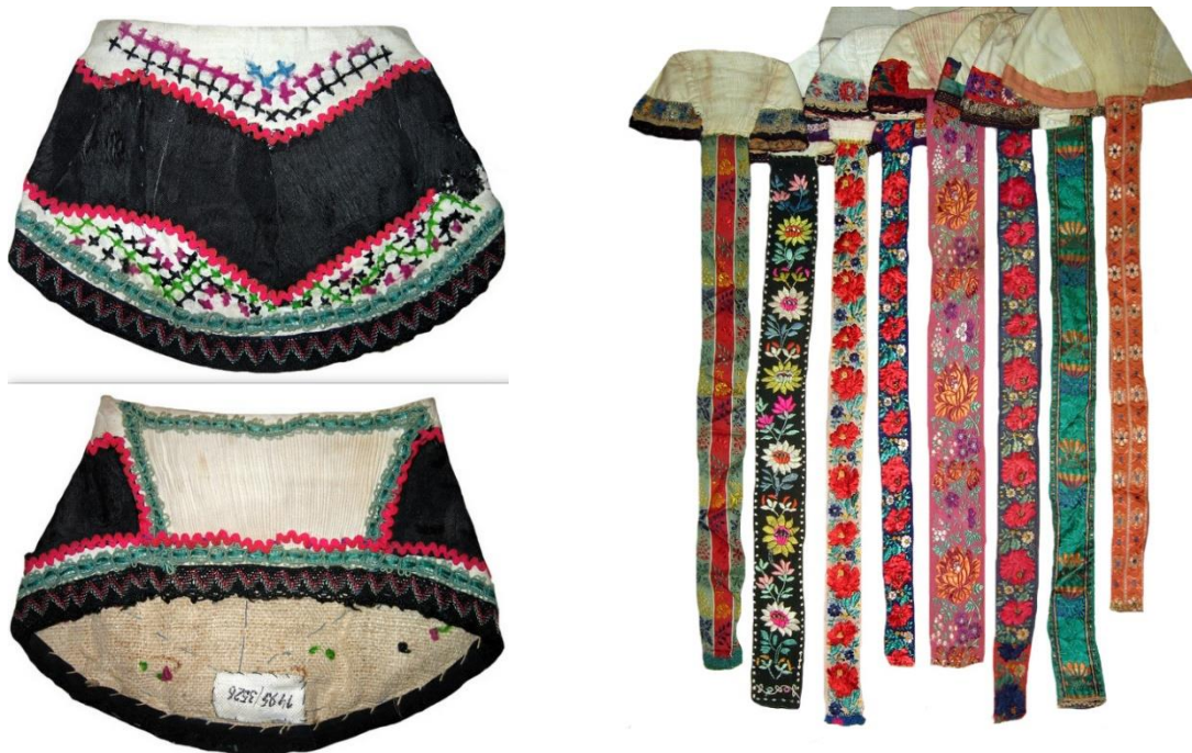
Рис. 10. Чепець («чепак»), с. Зарічево, Перечинський район. Домоткане полотно, фабрична матерія, стрічки, вишивка, хрестик. 20-ті рр. XX ст.