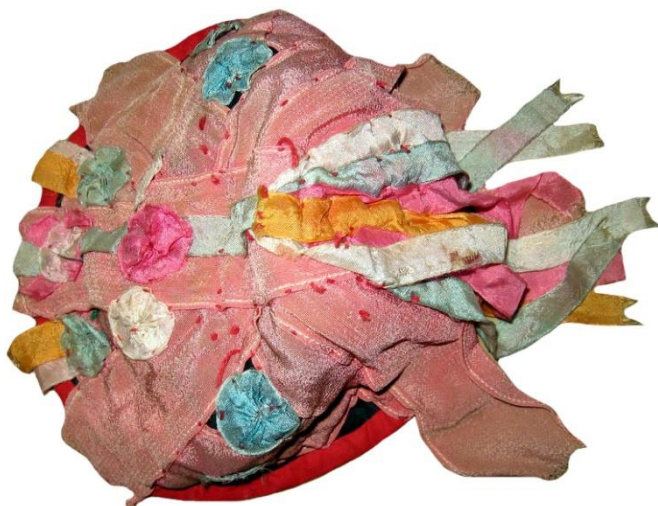
Рис. 3. Чепець («чепак»), с. Довге Іршавський район. Фабрична матерія, атласні стрічки. 20-ті рр. XX ст.