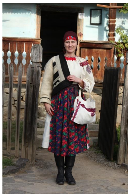
Рис. 4. Спосіб одягання чепця у боржавських долинянок.