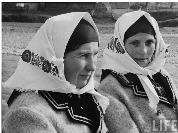
Рис. 8. Жінки з с. Ізки Міжгірського району. 1939 р.