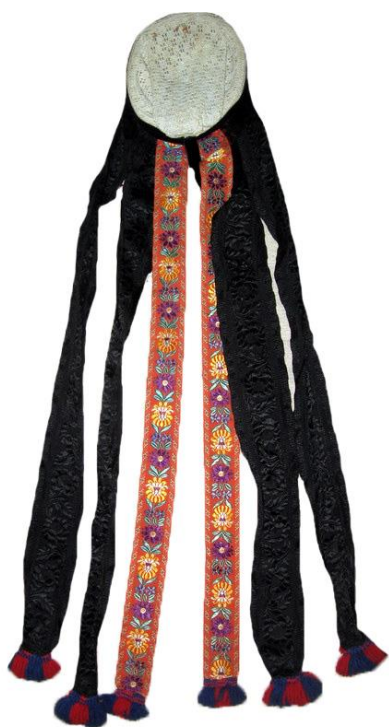
Рис. 7. Чепець, с. Рудовець-Майдан, Міжгірський район. Картон, мереживо («сітка»), фабричні стрічки, вовняні нитки. Початок 20-х рр. XX ст.