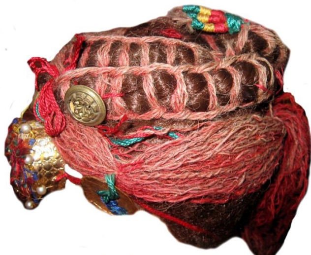
Рис. 5. Весільна зачіска («плетіння»), с. Ясіня, Рахівський район. 20-40-ві рр. XX ст.