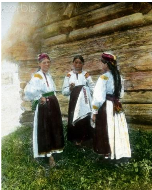
Рис. 9. Лемкині Закарпаття у чепцях зі стрічками («партицями»).