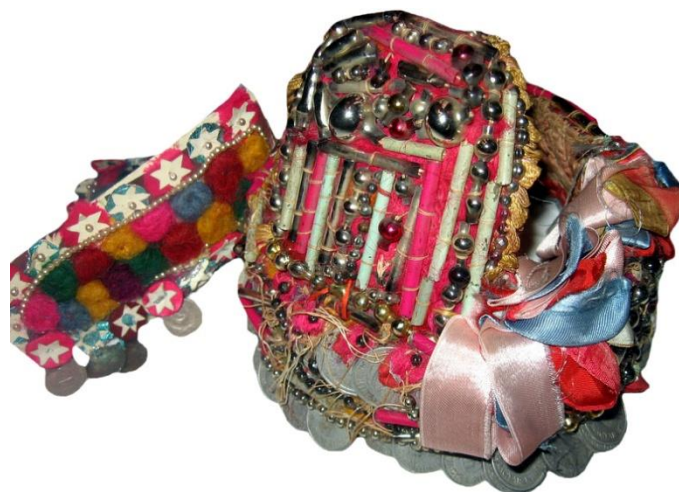
Рис. 2. Весільний дівочий вінок («парта»), с. Данилово, Хустський район. Фабрична матерія, картон, стрічки, вовняні нитки, бісер, стеклярус, штучні квіти, монети. 20-40-ві рр. XX ст.