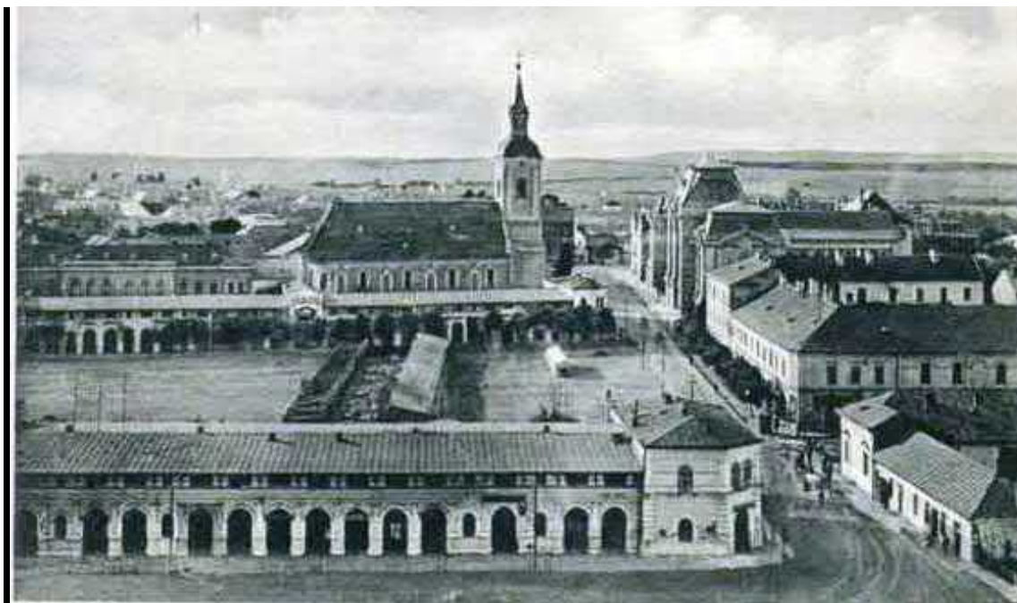
Рис. 3. Ринкова площа та реформатська церква в Берегові на початку XX ст. (ймовірне місце францисканського монастиря), [ https://karpatalja.ma/sorozatok/karpatalja-anno/karpatalja-anno-ilyen-volt-a-beregszaszi-hosok-tere/ (дата звернення 23.04.2021)].