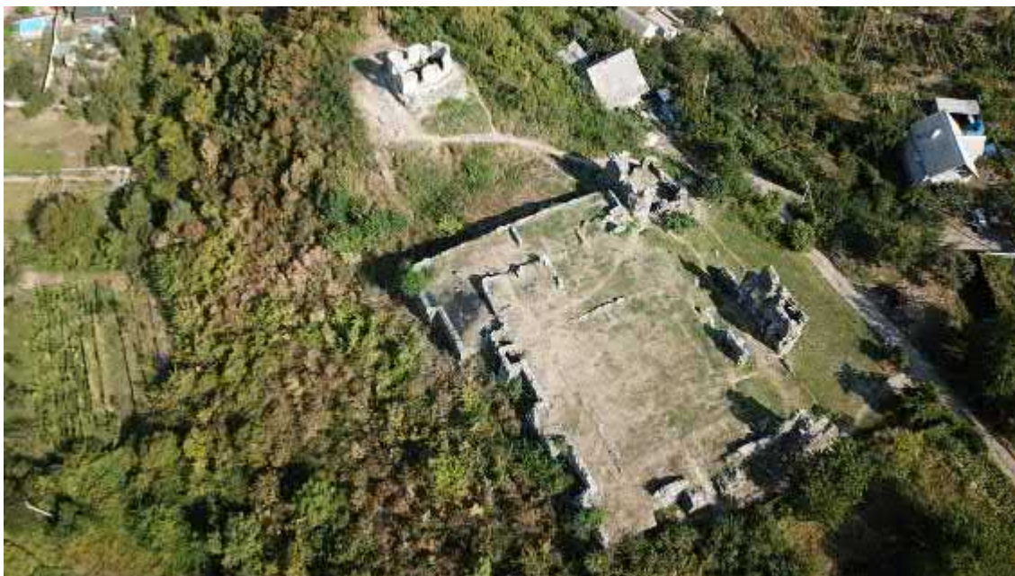
Рис. 2. Руїни замку Канко (сучасний вигляд)