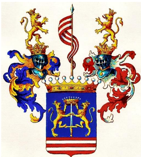
Іл. 3. Герб Кеглевич