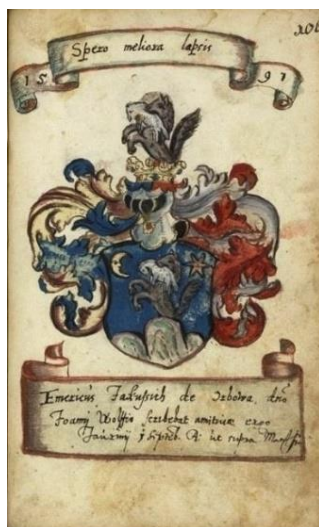
Іл. 5. Герб Якушич