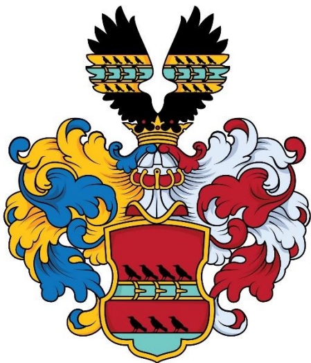
Іл. 1. Герб Другет