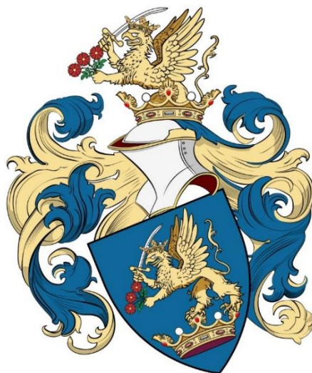
Іл. 2. Герб Естергазі