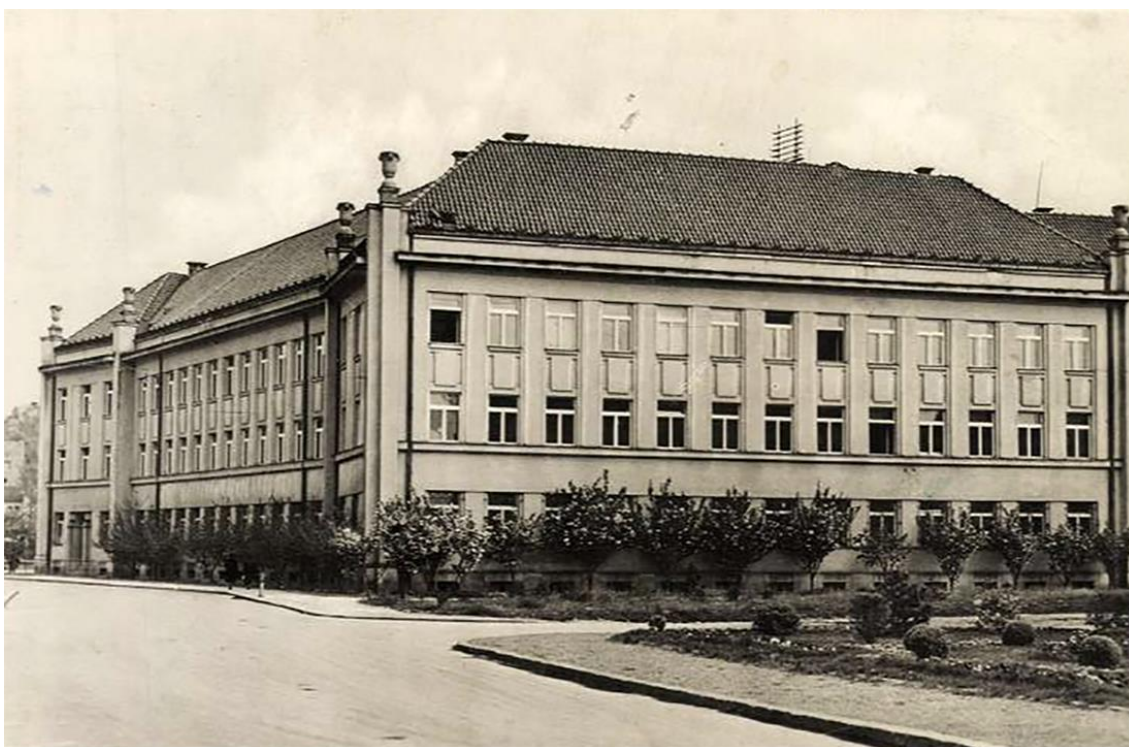
Рис. 2. Будівля поліцейського управління, південний і західний фасади, добова поштівка 1930-х рр.