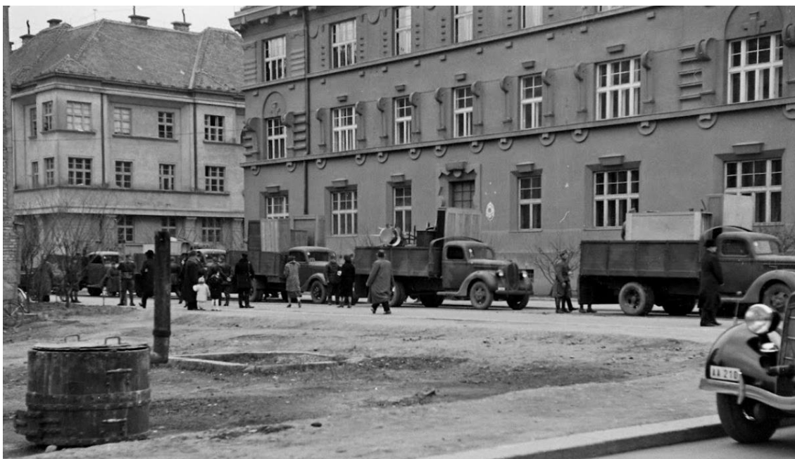
Рис. 1. Фрагмент чільного фасаду тимчасової будівлі уряду. Фото: William Vandivert, LIFE, травень, 1939 р.