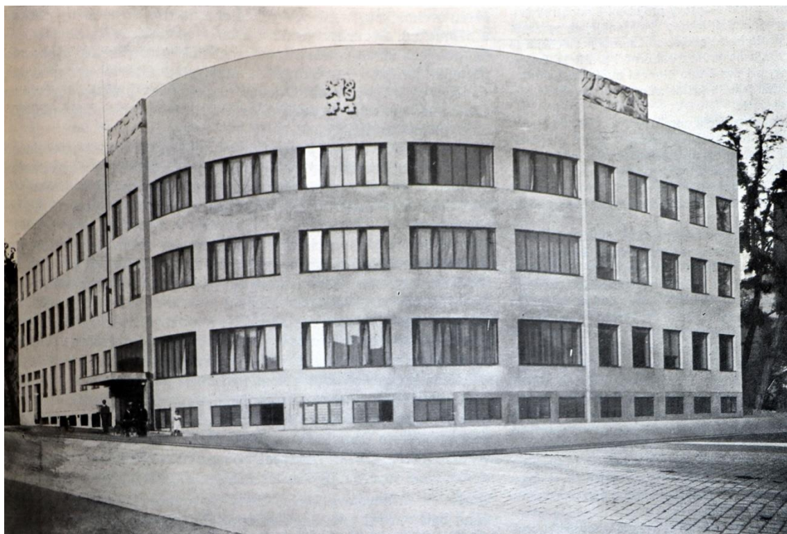
Рис. 7. Адміністрація пошти та телеграфу Підкарпатської Русі, Stavitel, роč. 6, č. 13, s. 74.