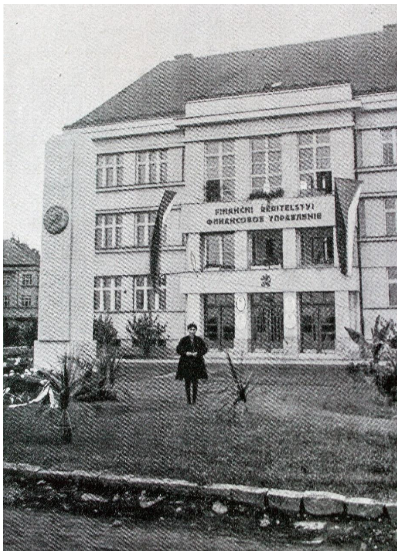
Рис. 5. Фінансове управління в м. Ужгороді, Stero črt a obrazků z Podkarpatské Rusi.