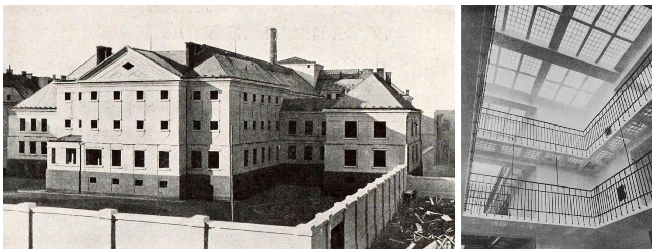
Рис. 4. В'язниця. Ліворуч: фасади будівлі з внутрішнім двором. Праворуч: інтер'єр в'язниці, Horizont , роč. 1, č. 1–10, с. 159, 161.