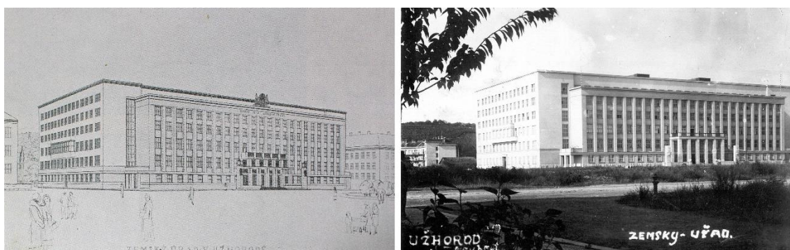
Рис. 8. Будівля Земського цивільного уряду Підкарпатської Русі. Ліворуч: ідейний ескіз будівлі, автор Ф. Крупка, Technická práce v zemi Podkarpatorské 1919 – 1933 , р. 56. Праворуч: чільний південний фасад будівлі 1930-х рр., добова поштівка.