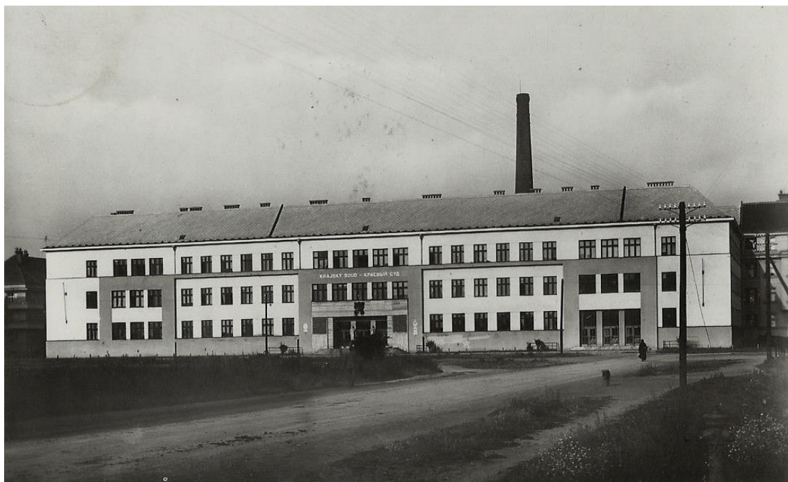
Рис. 3. Будівля Крайового суду, добова поштівка 1930-х рр.