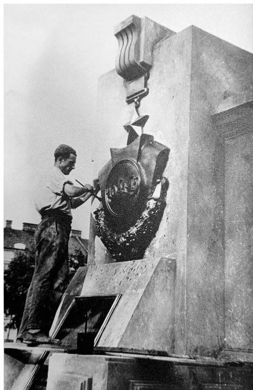
Рис. 4. Будівництво пам'ятника на військовому кладовищі в м. Станіславі (1946 р.). Державний архів Івано-Франківської області, ф. Р-11, оп. 2, спр. 7а.