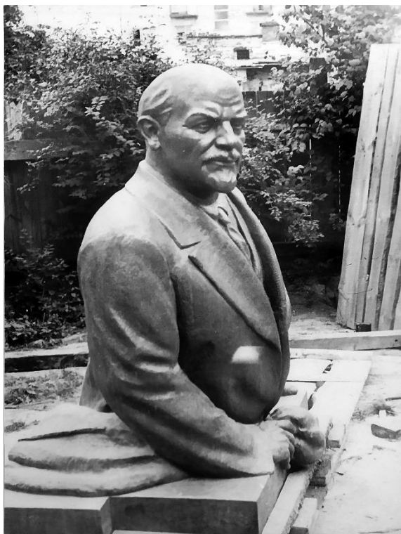
Рис. 1. Бронзова поясна фігура Леніна перед установленням у Львові (1952 р.). Центральний державний архів громадських об'єднань та українці, ф. 1, оп. 30, спр. 2757, арк. 5.