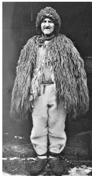
Рис. 1. Гуня жіноча. Хустський район. 20-ті рр. ХХ ст.. Рис. 2. Верховинець у косматій гуні, 20-ті рр. ХХ ст. Листівка 20-30-х рр. ХХ ст..