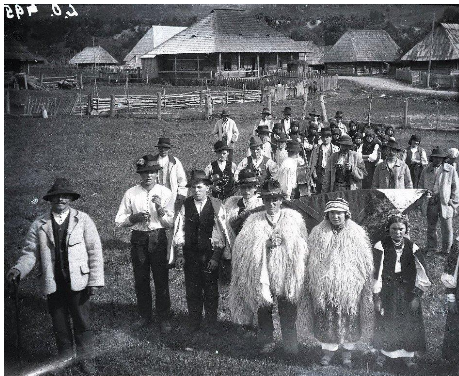
Рис. 4. Весілля у селі Синевир на Міжгірщині, 20-ті рр. XX ст.